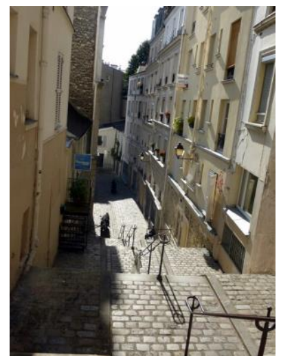
Passage des Abbesses