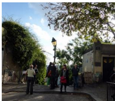
Conflanaises en goquette