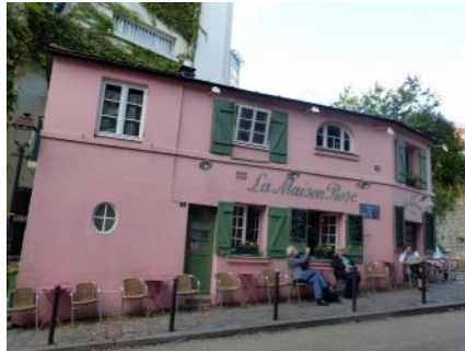
La maison rose