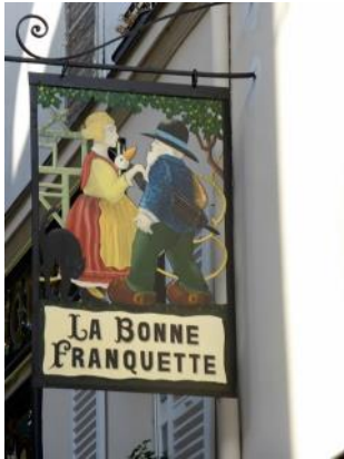
Ça donne envie!

♪ Monte là-dessus et tu verras Montmartre... ♪