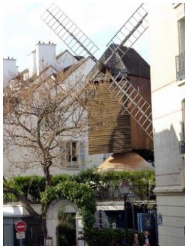
Le moulin de la Galette