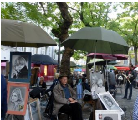
La place du Tertre