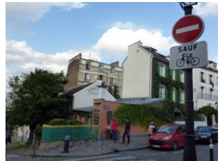
Le lapin agile