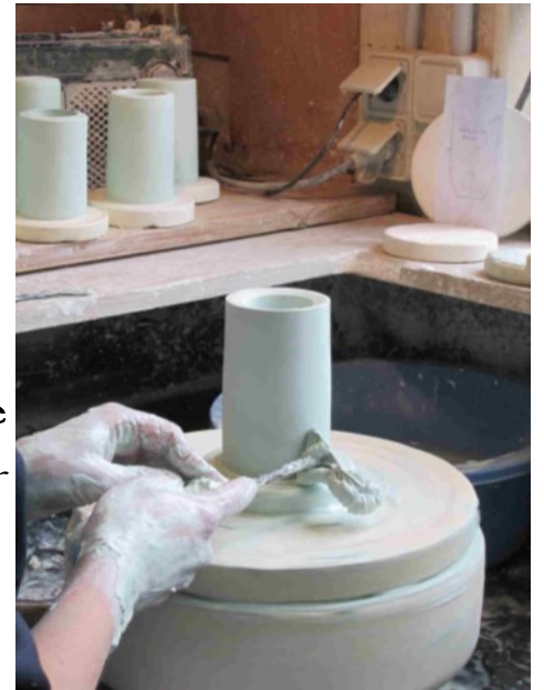
Le façonnage au tour

Les couleurs réalisées à partir de métaux réduits en poudre