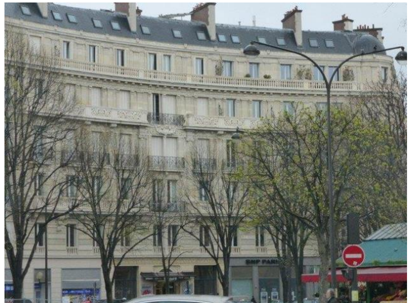
Place des Ternes