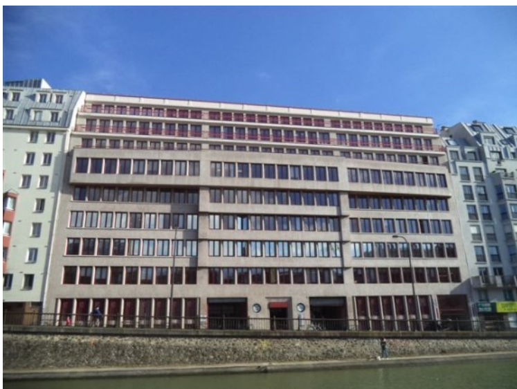
L'immeuble Combarel, conçu pour les ouvriers avec le maximum de services