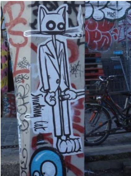
Art de la rue